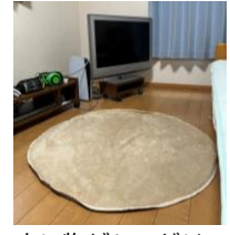
床に物がなければ片付いた印象になる