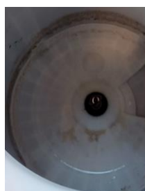
洗濯槽を外した 底の汚れ