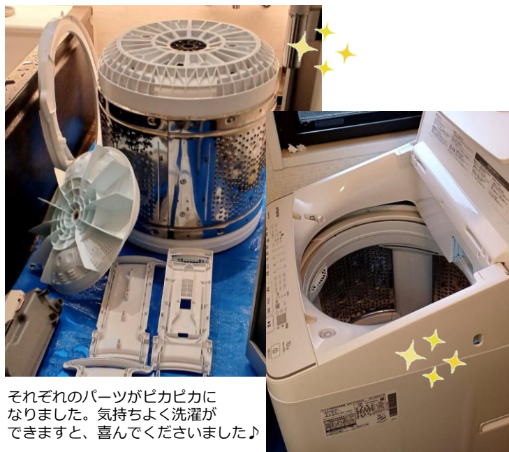
それぞれのパーツがピカピカになりました。気持ちよく洗濯ができますと、喜んでくださいました♪