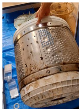
取り外した洗濯槽 見えない外まわりのカビ汚れ

洗濯機の分解洗浄のご依頼をいただきました。 洗濯槽クリーナーでは取り切れない洗濯槽の裏側に潜むカビや皮脂汚れも分解して丸洗いをします。 洗剤投入部分、洗濯槽の底の丸いパルセーター、洗濯槽などのパーツを取り外し、カビ汚れや石鹸カス、ほこりなどを徹底的に除菌洗浄していきます。 その後試運転でしっかり水洗浄をして完了です。 メーカーによりですが2～3時間の作業となります。