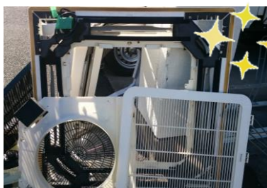
各部品もピカピカになりました