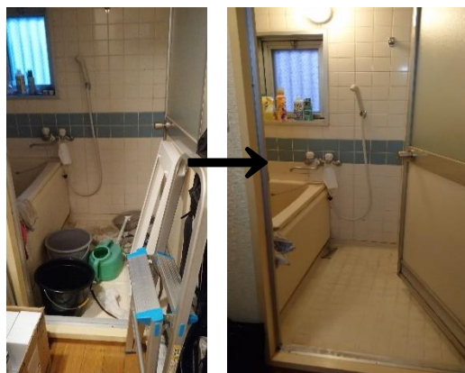
浴室 何もなくなってスッキリ!