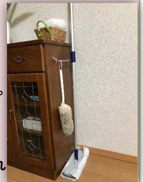
お掃除道具のグルーピング